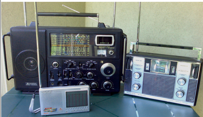
παλαιότεροι αναλογικοί δέκτες «παγκόσμιας λήψης»