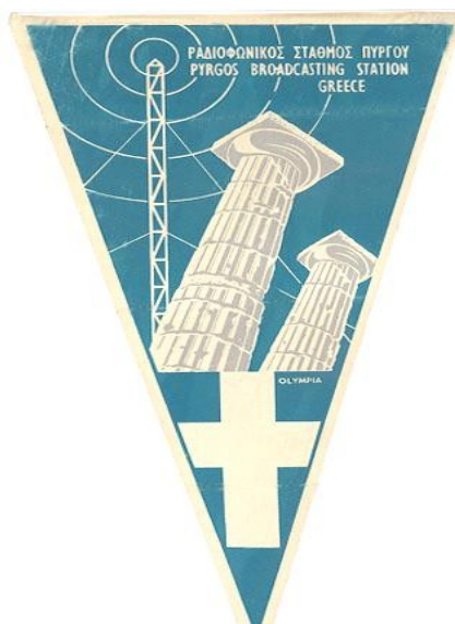
QSL κάρτα του ραδιοφωνικού σταθμού Πύργου